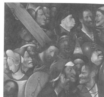
Le portement de croix de Bosch (~1516)