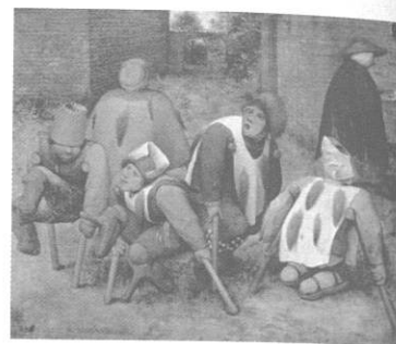
Les mendiants de Bruegel (1568)

Inscriptions : 06 27 58 69 76 - paroupiart@gmail.com - Tarif : 5€/Personne